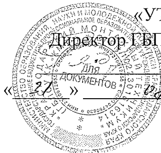
График заседаний Совета профилактики и защиты прав несовершеннолетних ГБПОУ КК «КМТ» в 2021-2022 учебном году. (каждый последний четверг месяца)